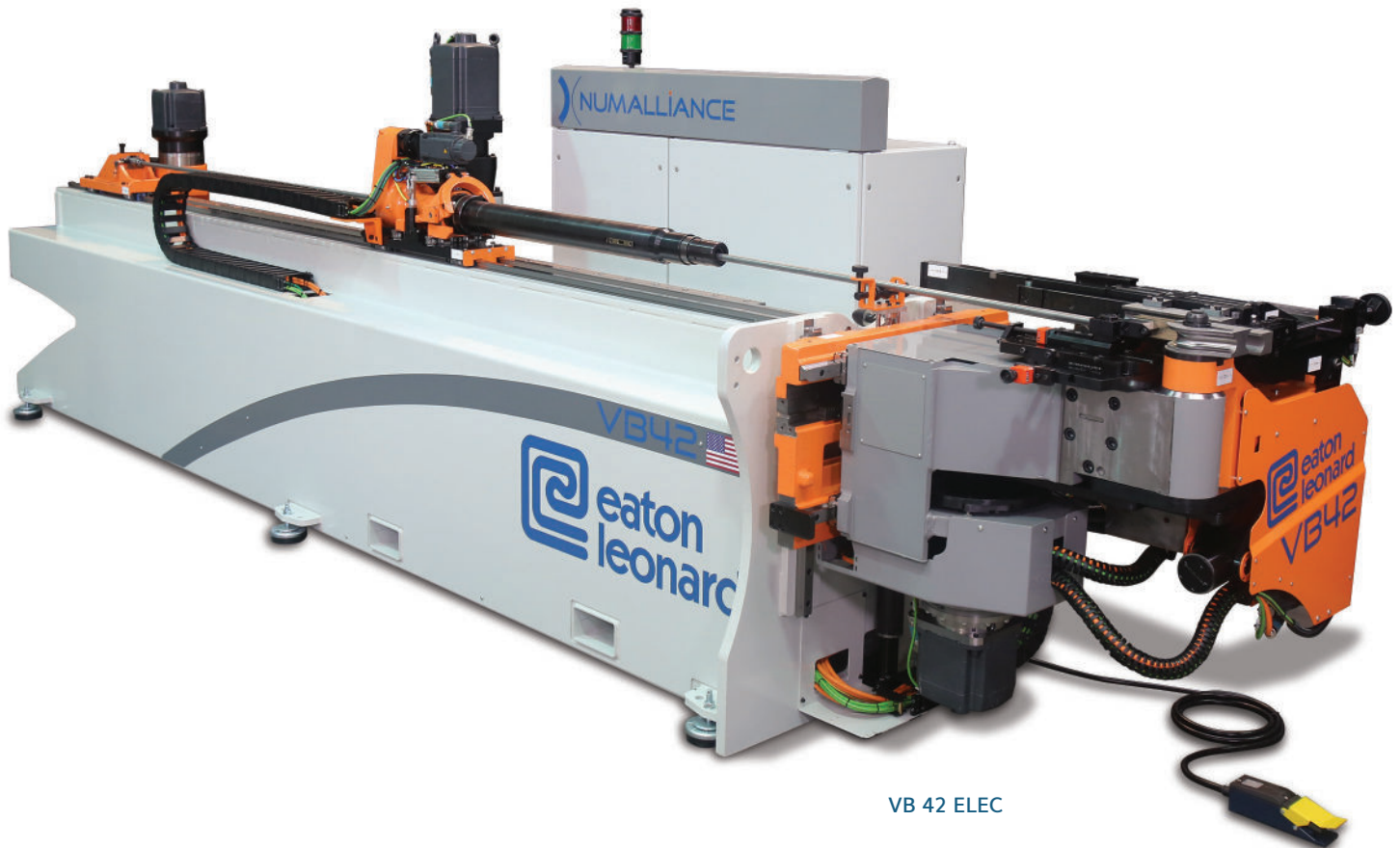
VB 42 ELEC